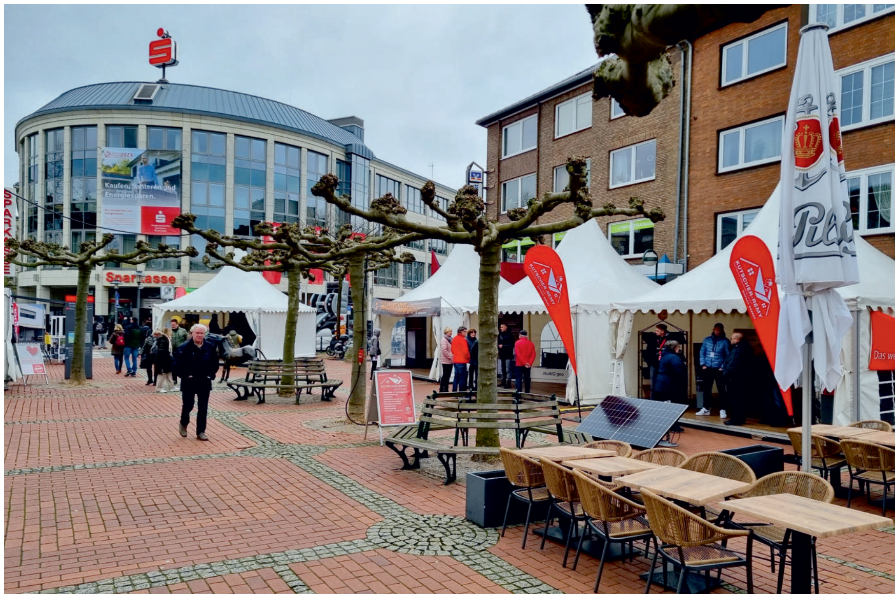
Am 6. und 7. April veranstaltet die Niederrheinische Sparkasse RheinLippe wieder ihre beliebte „Immobilien & Energie“.

Weitere Informationen zur Immobilien & Energie 2024 und zur großen Grundschul-Aktion gibt es auf nispade.de/immobilien .