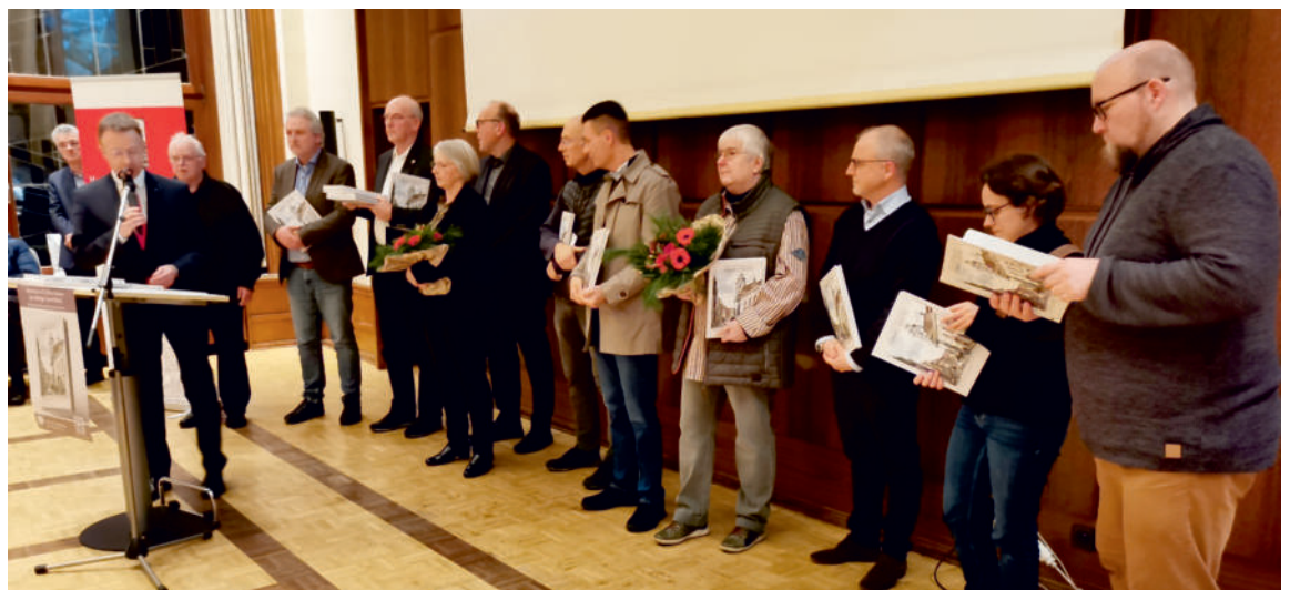
Gruppenbild aller Verantwortlichen und Förderer bei der Buchvorstellung