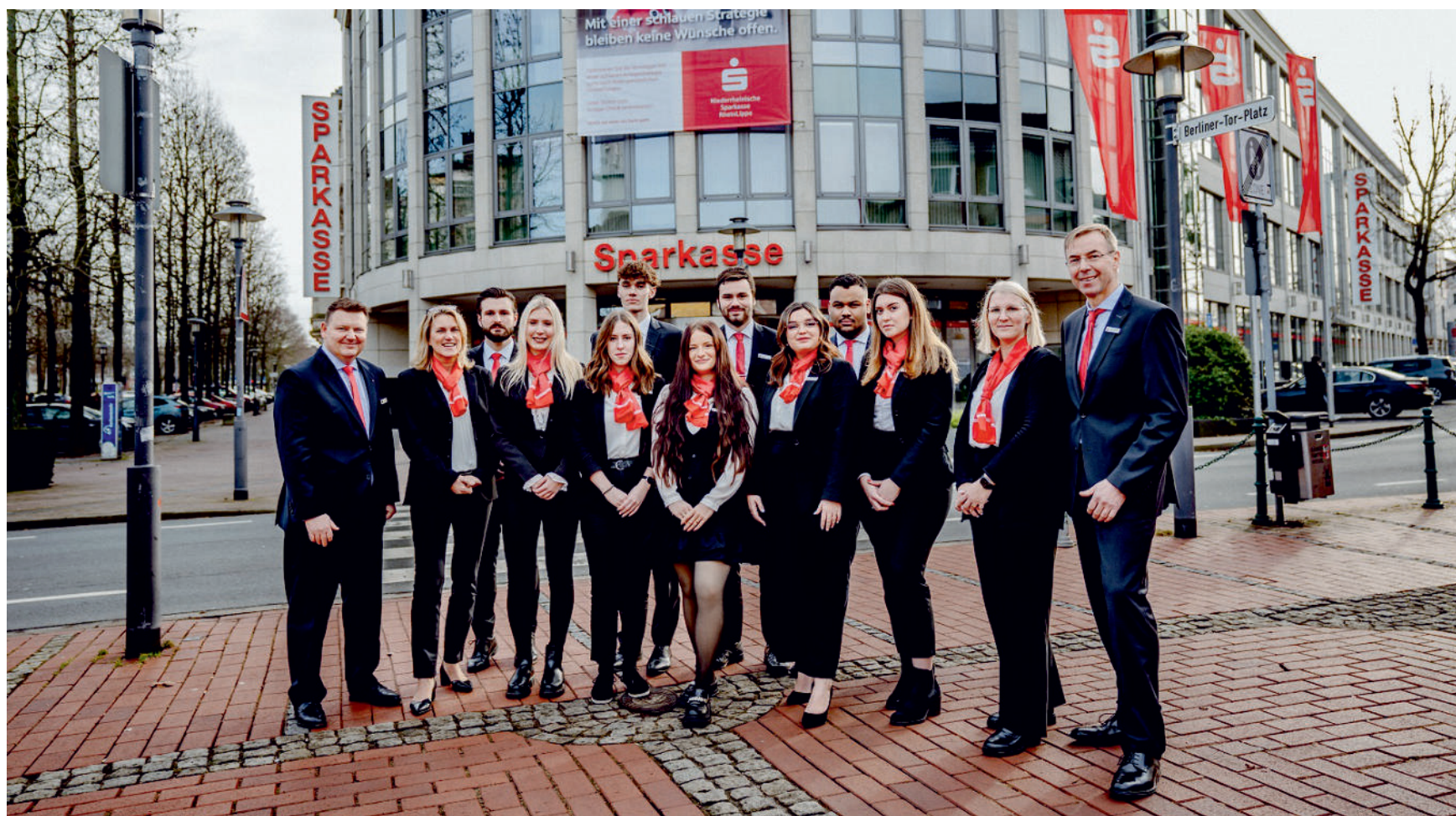
Die Nispa freut sich über die erfolgreichen Abschlussprüfungen ihrer Azubis.

Wer an einer Ausbildung bei der Nispa interessiert ist, findet alle Infos unter nispa.de/ausbildung .