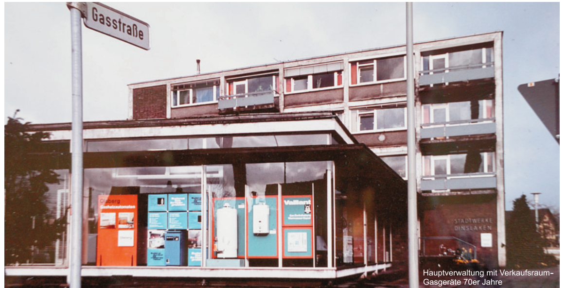
Hauptverwaltung mit Verkaufsraum-Gasgeräte 70er Jahre