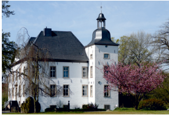
Voerdes beste Stube -Haus Voerde-

Voerde, Friedrichsfeld, Spellen, Möllen, Mehrum, Löhnen, Götterswickerhamm, Ork, Lippedorf und Holthausen, blickt auch auf eine, seit Erteilung der Stadtrechte (am 01.01.1981) schon 40jährige Stadtgeschichte zurück.