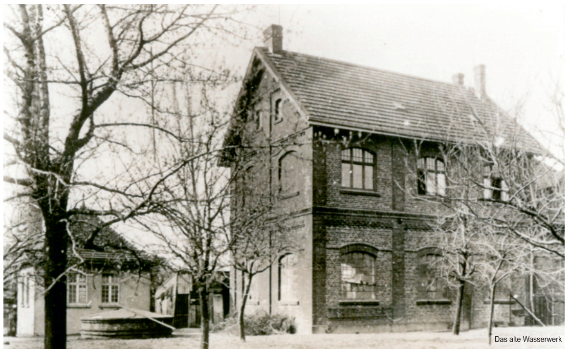
Das alte Wasserwerk

GmbH industrielle Abwärme. Seit den 2000er Jahren setzen die Stadtwerke Dinslaken auf Biomasse, Windkraft und Solarenergie sowohl zur eigenen Strom- als auch zur Wärmeerzeugung und leisten somit einen wertvollen Beitrag zu einer klimaschonenden Energieversorgung.